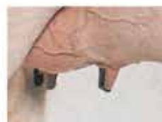
примерно 4,5 см.