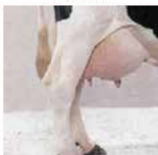
На уровне скакательного сустава