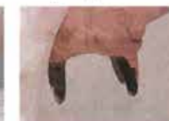
8 см. и длиннее