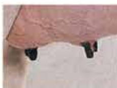
3 см. и короче