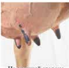
На внешней стороне долей вымени