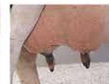
примерно 7 см.