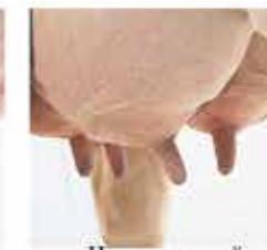
На внутренней стороне долей вымени