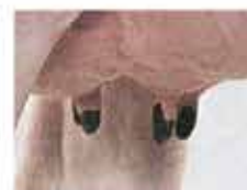
примерно 6 см.