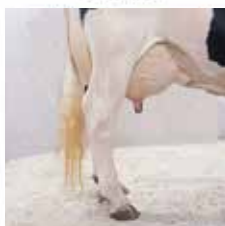
Выше скакательного сустава